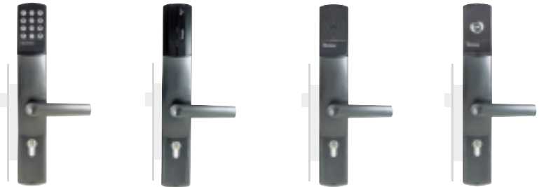
Clavier à code

Reprise du cylindre européen , plaque pour autre type de cylindre sur demande. Mise en libre passage à partir du clavier sans aucun outil.